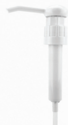
POMPKA DO KANISTRÓW: 3,78L, 5L, 10L, 20L 1 NACIŚNIĘCIE - 25-30 ML.